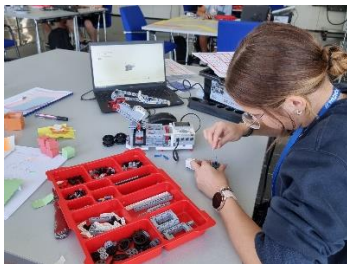
Bild 3: Smart Factory@Holiday 2022: Einführung in die Programmierung und Robotik