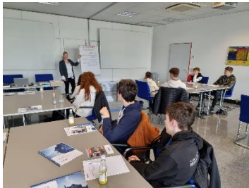
Bild 5: Smart Factory@Holiday 2022: Einblicke in die Berufswelt geben MPDV Mitarbeitende gerne weiter (Bildquelle: MPDV)

Bild 4: Smart Factory@Holiday 2022: Die Funktionsweise einer Smart Factory kann auch spielerisch kennengelernt werden (Bildquelle: MPDV)